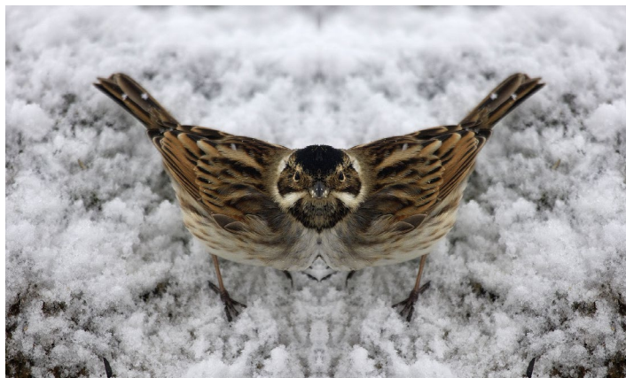
Julien Salaud Bruant des roseaux , digigraphie