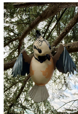
Julien Salaud, Nid de céramique (Mésange Hupée) , 2025

Les emplacements ont été déterminés en collaboration avec le Groupement ornithologique des Deux-Sèvres, également partenaire d'une conférence qui sera consacrée à la chouette effraie proposée au mois de mars 2026.