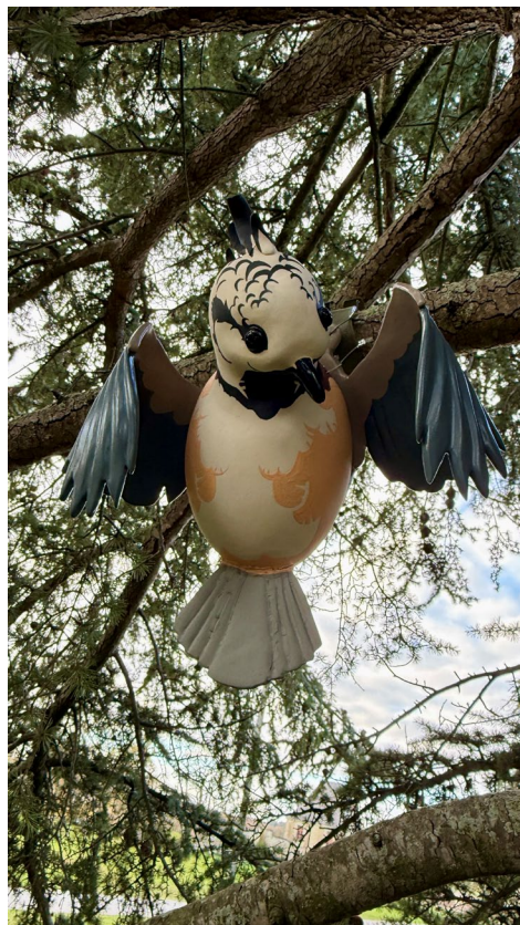
Julien Salaud, Nid de céramique (Mésange Hupée) , 2025