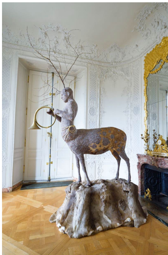
Julien Salaud, Printemps (Cerfaure) , vue de l'exposition Natures sauvages 2 au château de Rambouillet, centre des monuments nationaux. 2018.

À Oiron, l'artiste déploie une proposition spécialement conçue pour le monument, invitant les visiteurs à entrer dans un paysage hivernal où les oiseaux deviennent les protagonistes du paysage extérieur et intérieur du château/les hôtes privilégiés du château.