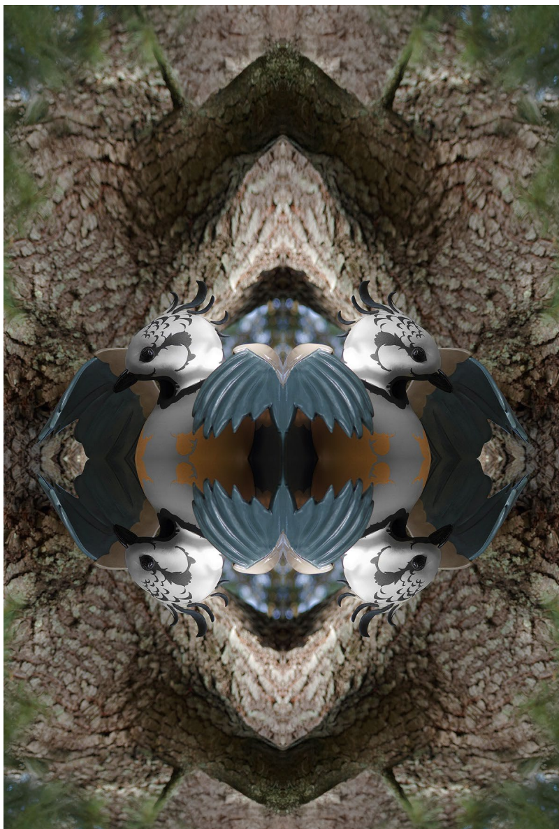
Julien Salaud, Quadrimesange huppée (nid de céramique), 2025

Contacts presse : Pôle presse : Ophélie Thiery et Lauren Laporte 01 44 61 22 45 / 01 44 61 22 26 presse@monuments-nationaux.fr