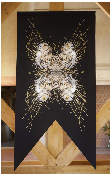
Julien Salaud, Étendard de grand duc (Neige) : gouache sur digigraphie, bois, clous, 2 x 1m, 2025.