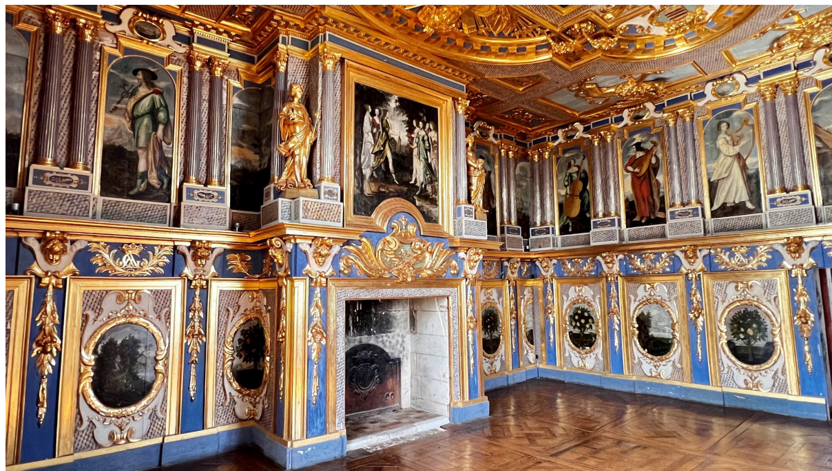
Château d'Oiron, cabinet des muses

En 1700, madame de Montespan achète le château, au nom de son fils le duc d'Antin. Elle partage sa vie entre sa propriété d'Oiron et Bourbon-l'Archambault où elle meurt en 1707. L'état général du château se dégrade lentement et dès 1840 Prosper Mérimée, Inspecteur général des monuments historiques, attire l'attention sur la nécessité de sauvegarder les fresques de la galerie Renaissance. Le château est classé Monument Historique en 1923 et acheté par l'État en 1941.