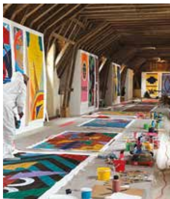
Matrimoine, Château d'Oiron, 2023.