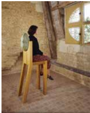
Marina ABRAMOVIC, Room for departure, 1994. Commande publique, collection Cnap