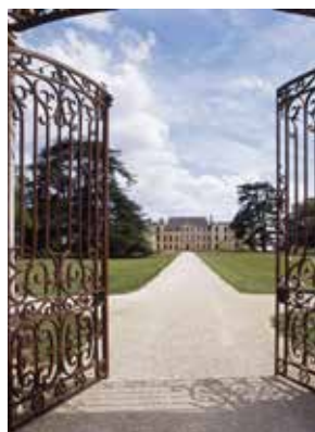
Château d'Oiron, porte flamande et allée conduisant au château