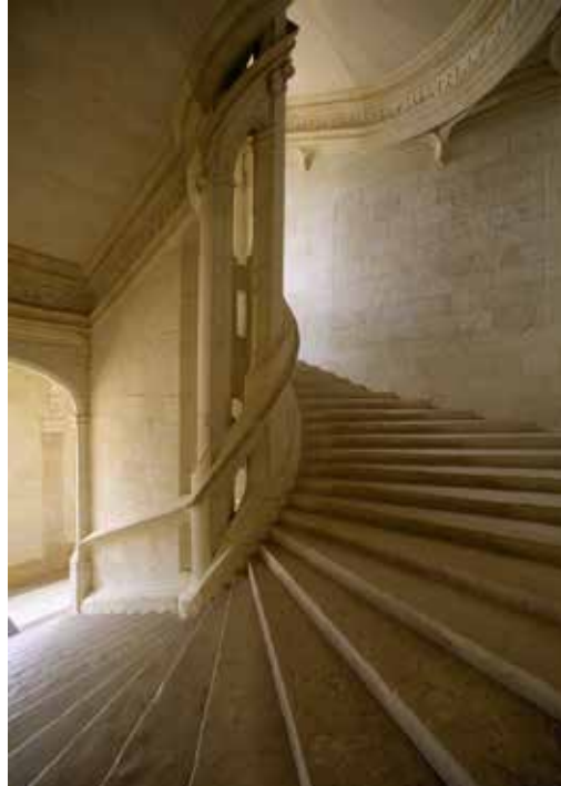
Escalier d'honneur