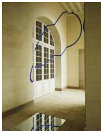
Felice Varini, Carré au sol aux quatre ellipses, bleu, 1993. Commande publique, collection Cnap