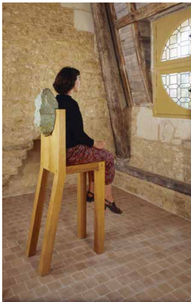
Marina ABRAMOVIC, Room for departure, 1994. Commande publique, collection Cnap