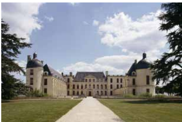
Château d'Oiron, allée conduisant au château