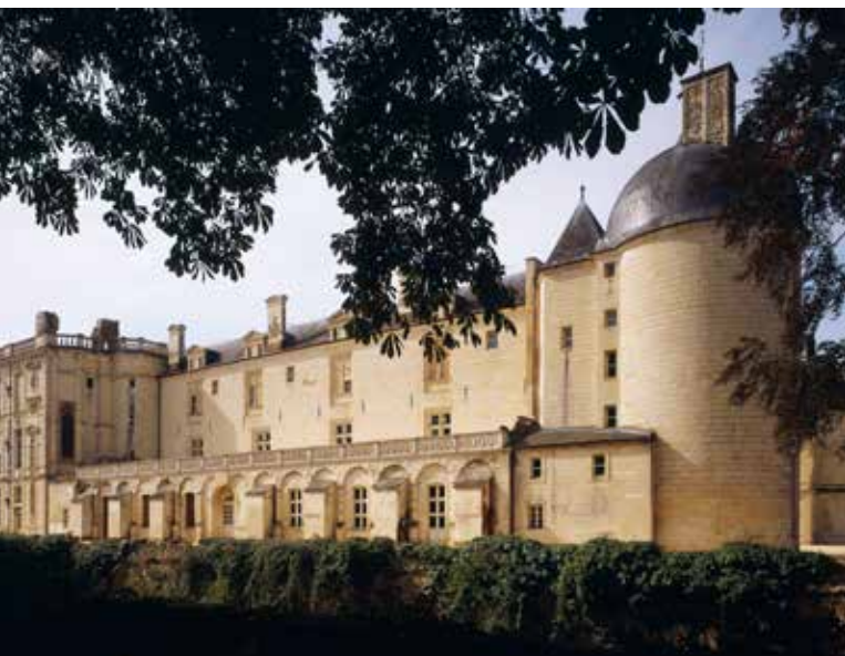
Château d'Oiron, aile nord-est, façade sur jardin

En 1700, madame de Montespan achète le château, au nom de son fils le duc d'Antin. Elle partage sa vie entre sa propriété d'Oiron et Bourbon-l'Archambault où elle meurt en 1707.