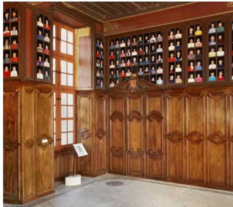
Galerie de portraits. Christian Boltanski, Les Ecoliers d'Oiron, 1993-2000. Commande publique, collection Cnap