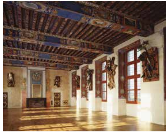
Daniel Spoerri, Corps en morceaux, 1993. Commande publique, collection Cnap