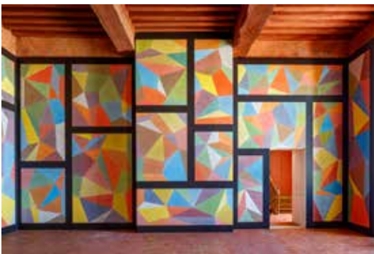
Sol LeWitt, Wall Drawings #752, 1994. Commande publique, collection Cnap