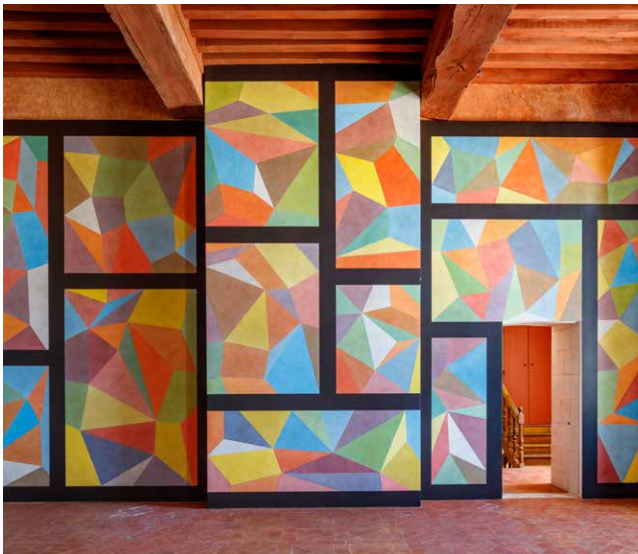
Sol LeWitt, Wall Drawings #752, 1994. Commande publique, collection Cnap