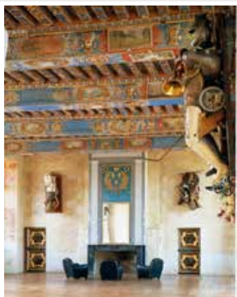
Daniel Spoerri, Corps en morceaux, 1993. Commande publique, collection Cnap