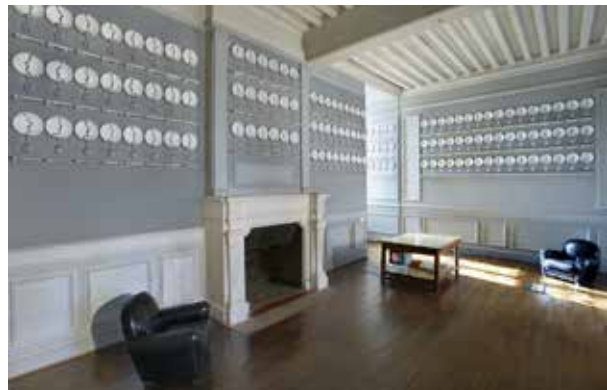
Raoul Marek, La Salle à manger, 1993. Commande publique, collection Cnap.