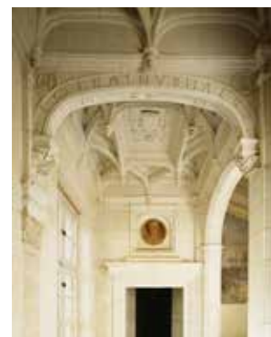
Escalier d'honneur plafond