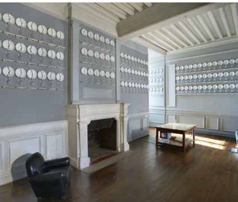
Raoul Marek, La Salle à manger, 1993. Commande publique, collection Cnap.

L'œuvre s'inscrit dans un projet plus large, La salle à manger du monde , visant à proposer des repas de cultures différentes, soulignant la variété d'usages, de rites, et d'instruments.